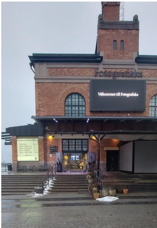
Fotografiska museets fasad