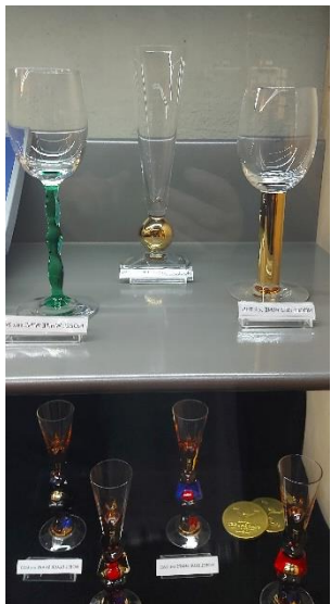
En bild på Nobelglasen