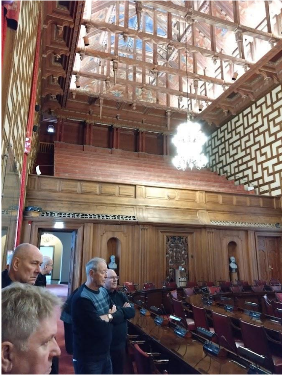
Visning och guidning av den magnifika mötessalen där Stockholmstad har sina styrelsesammanträden