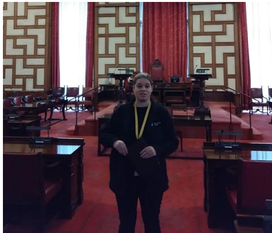
Pelarsalen där Prins Eugen har gjort sina vackra väggmålningar