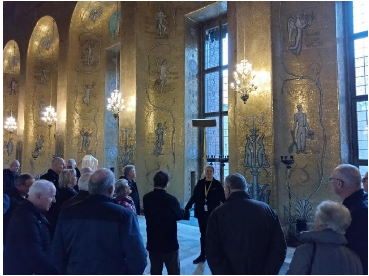
Bilder ovan, "Gyllenesalen" i all sin guldglans

Väggbeklädnaden består av mängder av typ små mosaikplattor tillverkade av 2st glasskivor med tunt bladguld emellan