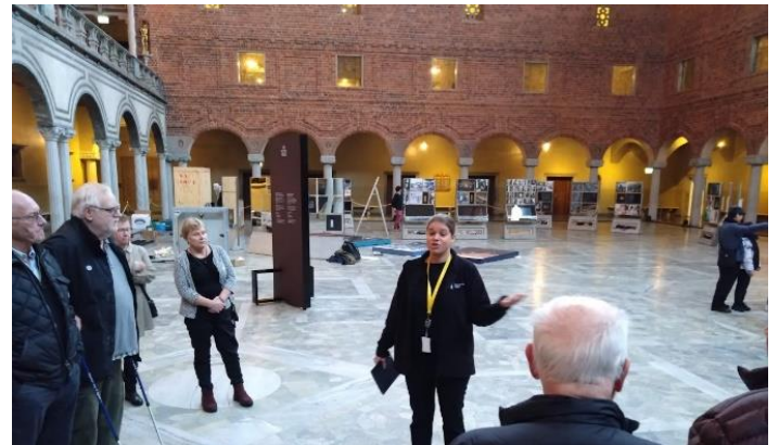
En mycket duktig och påläst guide presenterade stadshusbyggnaden med dess intressanta historia och arkitektur, här "Blå hallen"